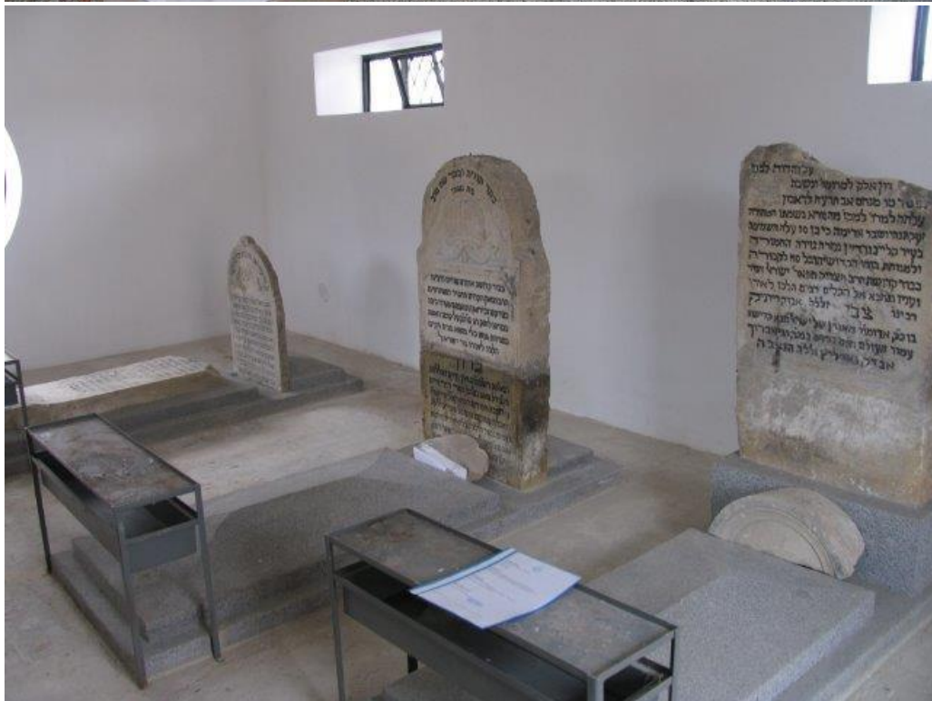
- Cmentarz w Rzepienniku Strzyżewskim. Na zlecenie Dawida Dembitzera z NY, potomka rzepiennickich Żydów skompletowana została dokumentacja budowy ogrodzenia [fot. 10-11].