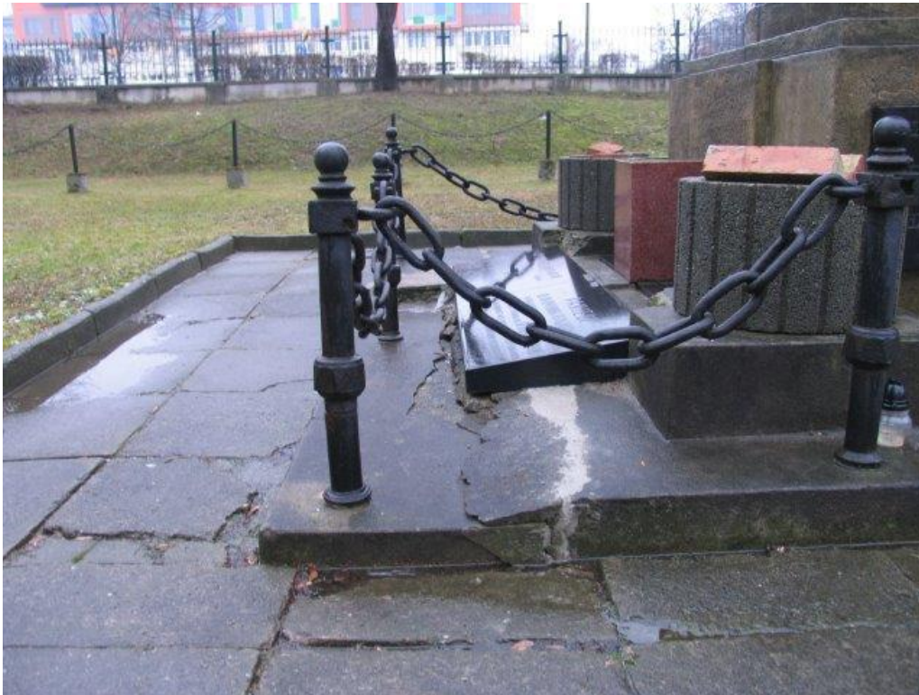
- Wymiana tablic informacyjnych na cmentarzu – koszt ok. 3000 PLN: 800 USD [fot. 22].